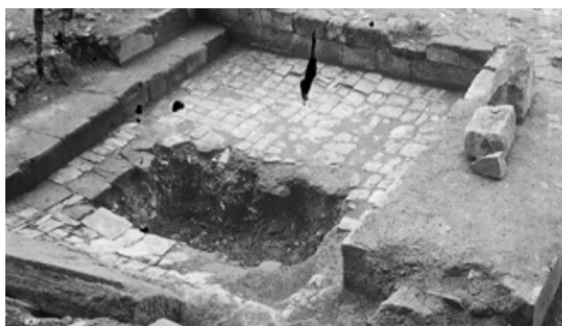
Fotografie údajného Juditina hrobu v teplické bazilice po vybraní ostatků (1954)