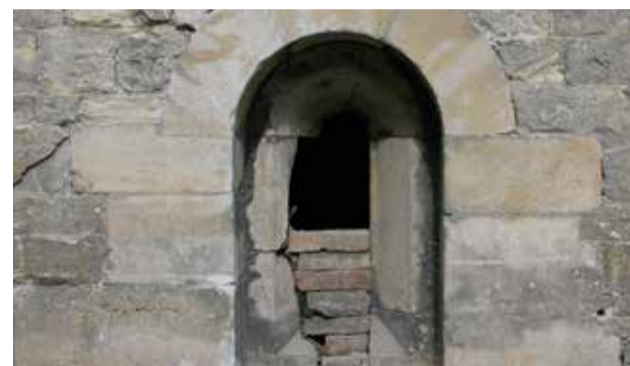
Snímek jednoho z románských okének východního křídla konventu před rekonstrukcí (2007)

že se nacházel na stejném místě jako pozdější klášter, dnešní zámek. Tzv. rezidenční dvůr tu existoval již v první polovině 12. století (možná dokonce dříve) a jeho hlavní obytnou budovou byla kamenná románská věž z opuky, jejíž zbytky byly objeveny při vykopávkách v roce 2008. Kolem ní byla nejspíše dřevěná zástavba, doložená jámami po kůlech a doprovázená dalšími nálezy. Kromě zbytků keramických nádob je mezi nimi také úlomek stříbrného denáru knížete Vladislava I. z let 1120–1125.