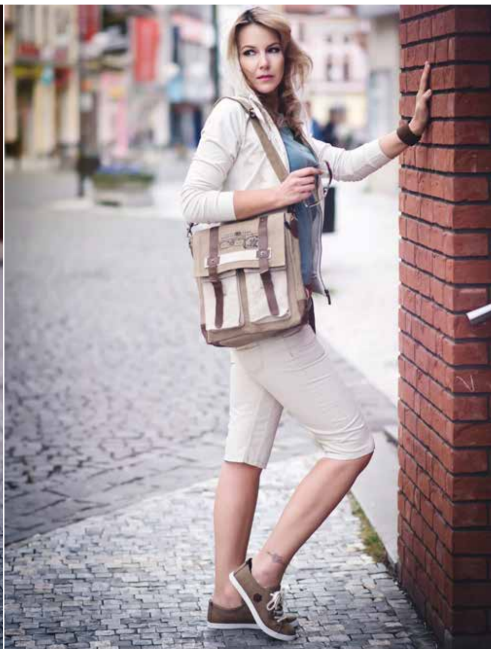
VOLNÝ ČAS: BUSHMAN Kalhoty I 599,- BUSHMAN Tričko 799,- BUSHMAN Mikina I 899,- BUSHMAN Náramek 130,- HOME Taška I 200,- JOHN GARFIELD Boty 949,- PRIMOSSA Brýle Armani 4 300,-