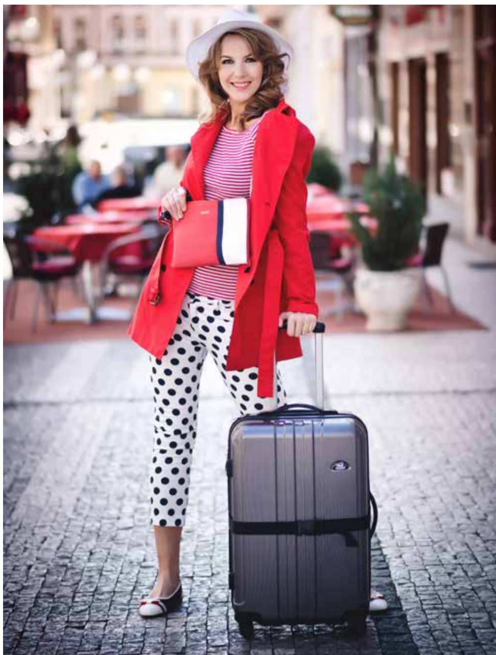
NA CESTÁCH: ELTE Kalhoty 4 399,- BENETTON Kabát 2 899,- BENETTON Tričko 549,- ELTE Psaníčko LIU-JO 2 199,- JOHN GARFIELD Boty 459,- TERRANOVA Klobouk 299,- JOHN GARFIELD Kufř 2 159,-