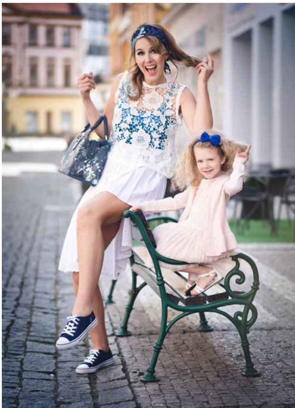
DO MĚSTA: DÁMSKÉ OBLEČENÍ: ELTE Kabelka + šátek 5 399,- ELTE Sukně 5 799,- ELTE Krajkový top 3 699,- BENETTON Tílko 249,- JOHN GARFIELD Boty 359,- DĚTSKÉ OBLEČENÍ: BENETTON Šaty 799,- BENETTON Svetřík 599,- JOHN GARFIELD Sandále 579,- COCCO Mašle 49,-