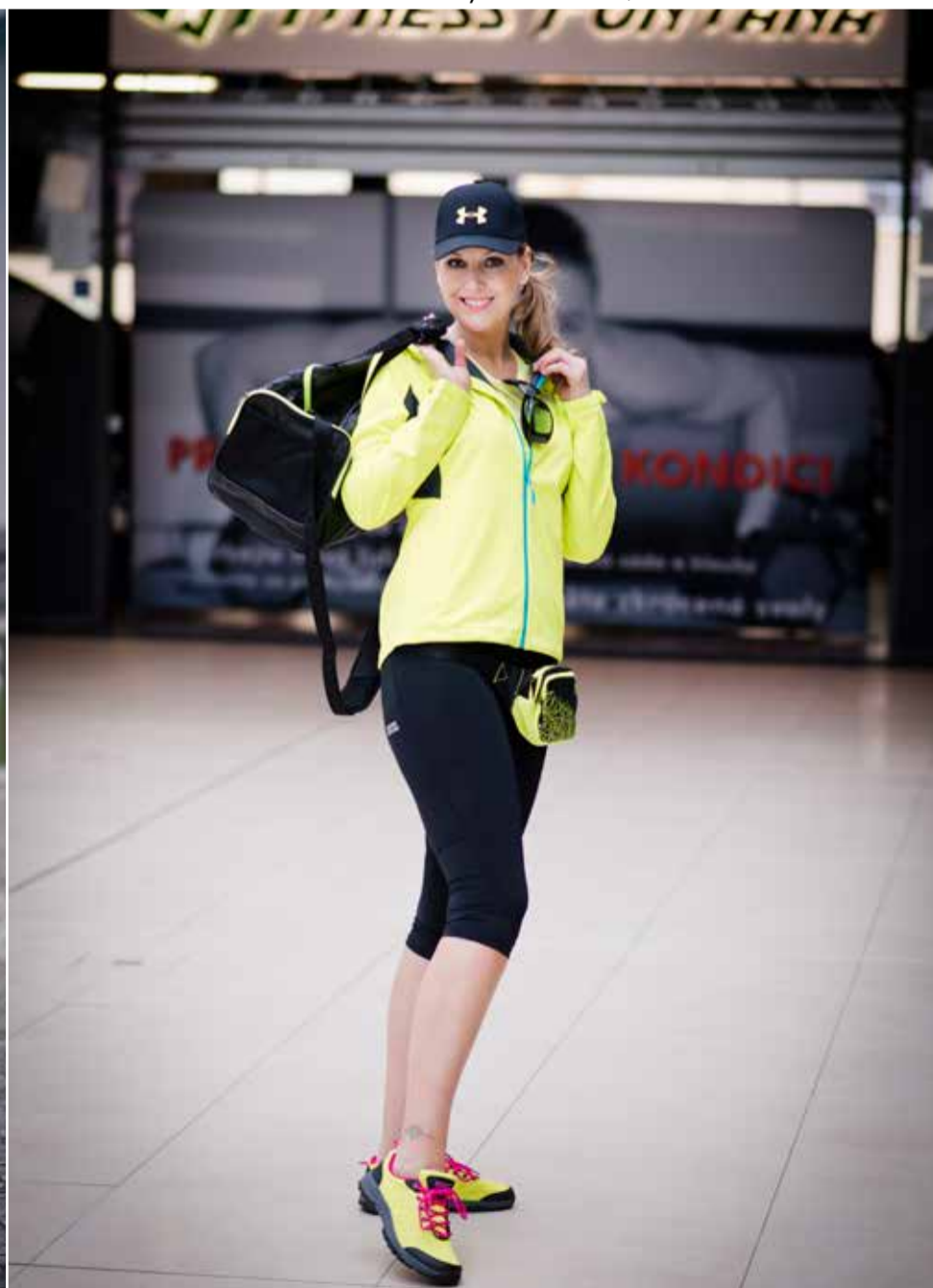
NA SPORT: NORDBLANC Kalhoty I 295,- NORDBLANC Tričko 695,- NORDBLANC Boty 995,- NORDBLANC Bunda 2 495,- PRIMOSSA Brýle 4 500,- BENDA SPORT Kšiltovka 440,- SPORTISIMO Ledvinka 290,- 169,- SPORTISIMO Taška +140,- 899,-