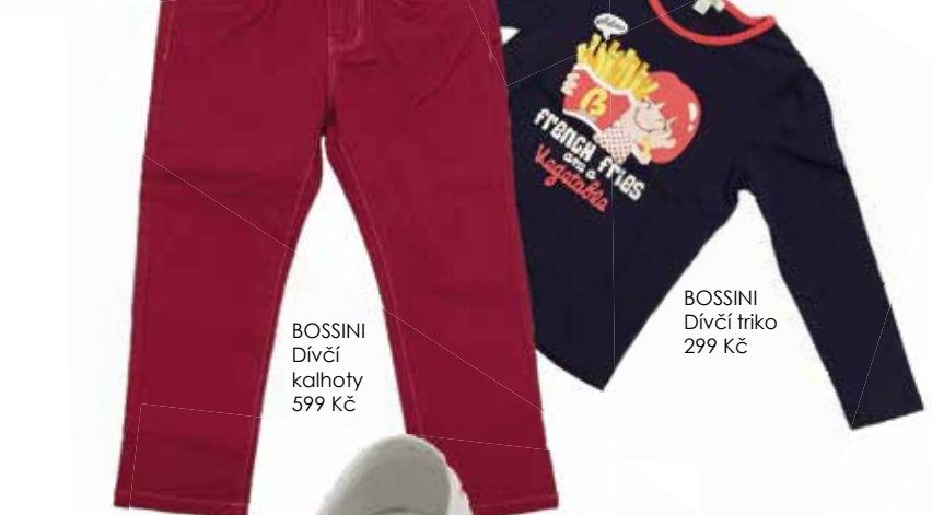
BOSSINI Dívčí kalhoty 599 Kč