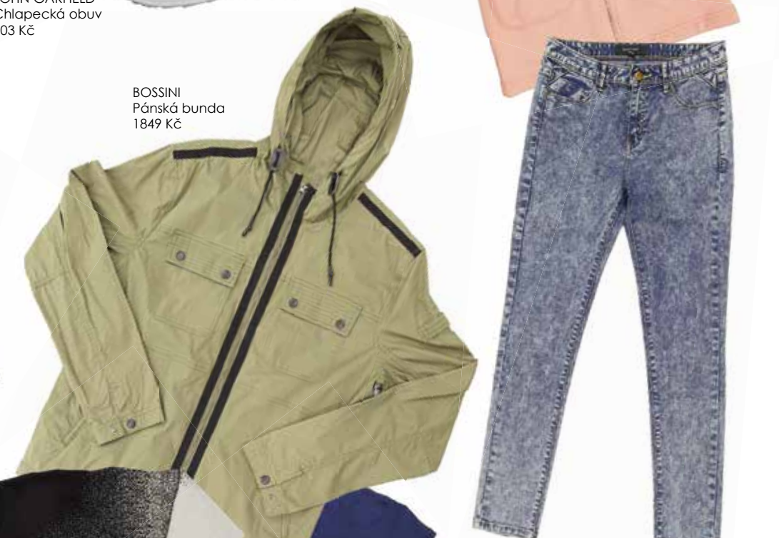
BOSSINI Dámské jeansy 799 Kč