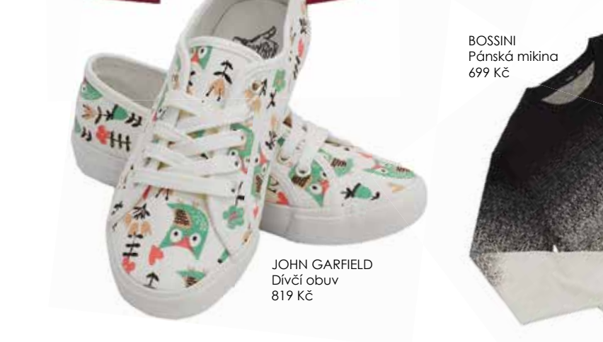
JOHN GARFIELD Dívčí obuv 819 Kč