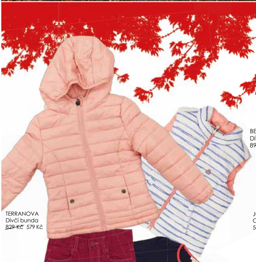
TERRANOVA Dívčí bunda 829 Kč 579 Kč