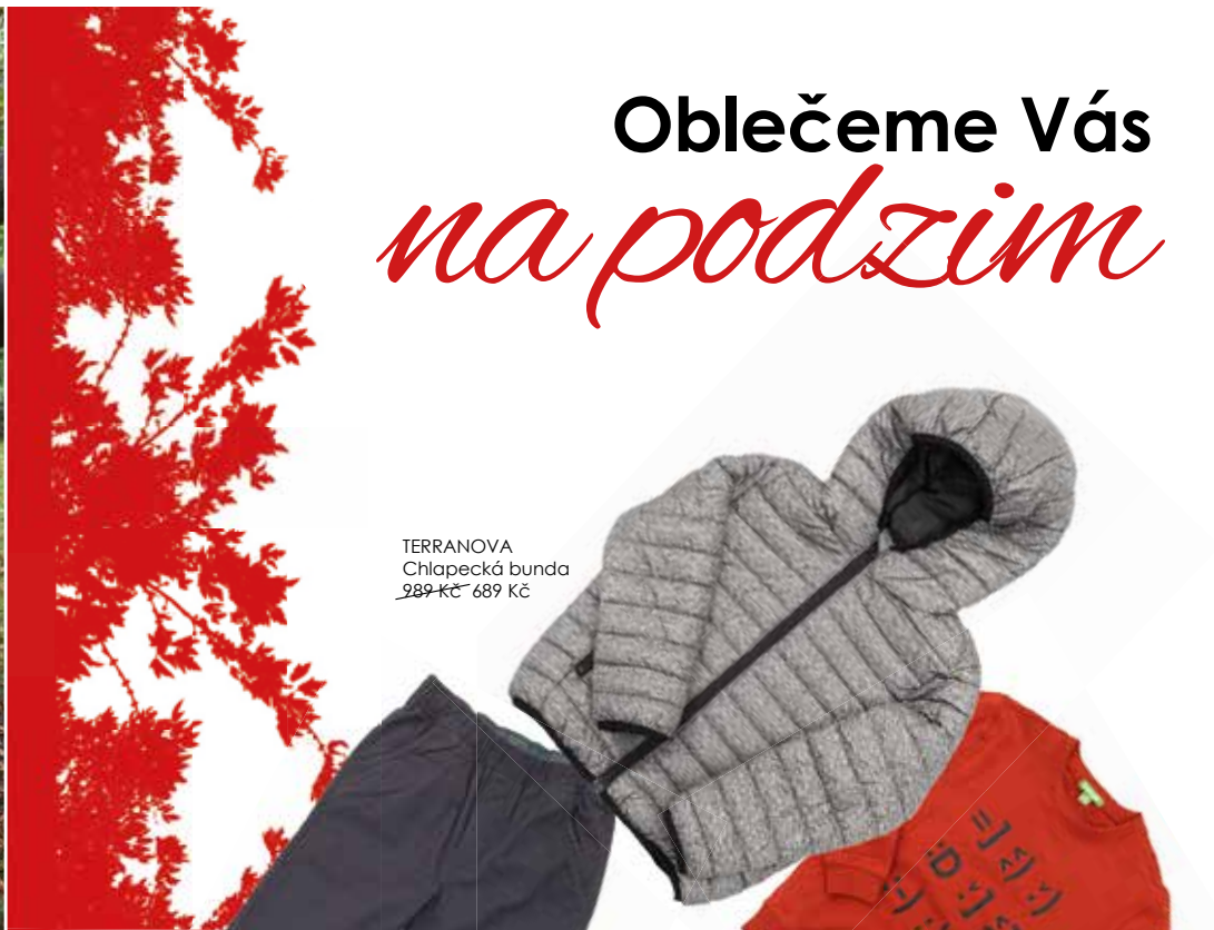
TERRANOVA Chlapecká bunda 289 Kč 689 Kč