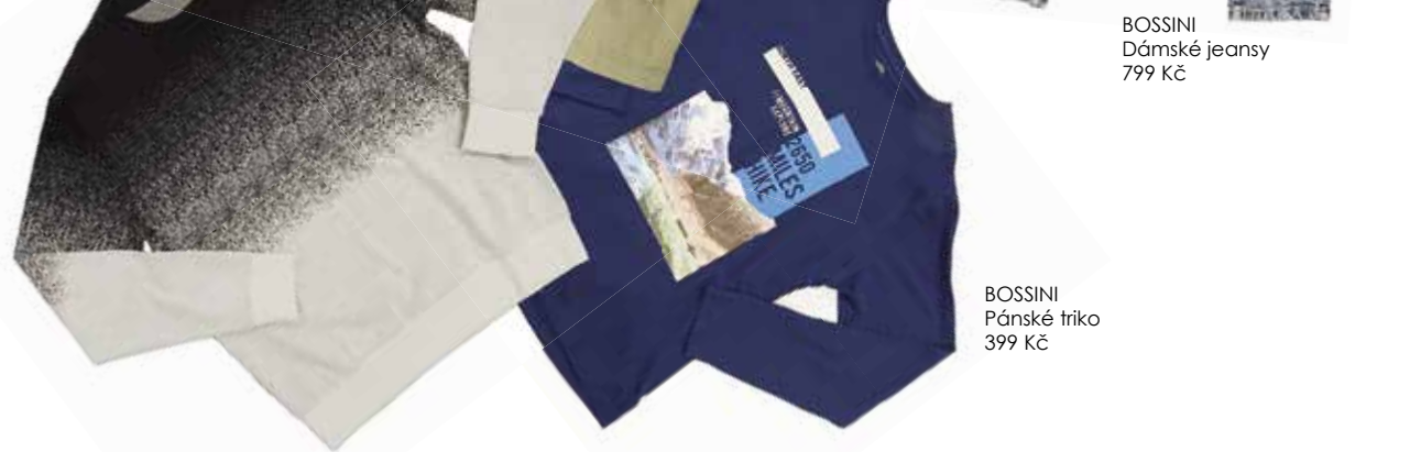
BOSSINI Pánské triko 399 Kč

Fotografie - oděvy ZLEVA | Triko 399 Kč, kalhoty 499 Kč | Mikina 599 Kč, kalhoty 499 Kč | Mikina 599 Kč, jeansy 949 Kč | Svetr 399 Kč, kalhoty 299 Kč | Triko 449 Kč, bunda 1649 Kč, jeansy 799 Kč VŠE BOSSINI Fotografie - obuv ZLEVA | 499 Kč | 819 Kč | 1299 Kč 1099 Kč | 549 Kč | 1499 Kč VŠE JOHN GARFIELD