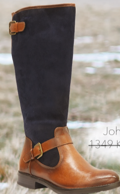
John Garfield 4349 Kč -> 1079 Kč