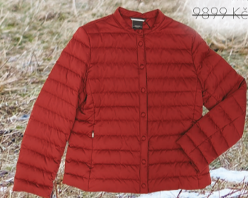
Marlenn 9899 Kč -> 6929 Kč