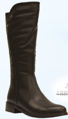
John Garfield 4889 Kč -> 1500 Kč