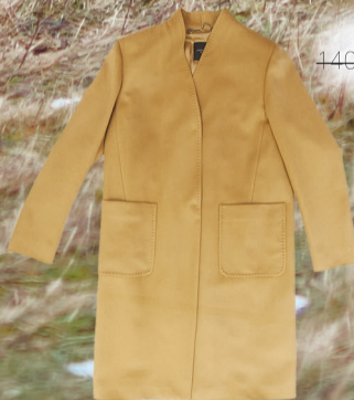
Marlenn 14099 Kč -> 9869 Kč