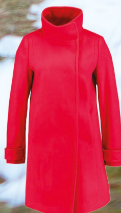
Benetton 3249 Kč