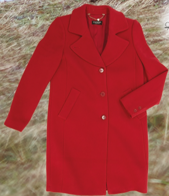
Marlenn 9199 Kč -> 6439 Kč