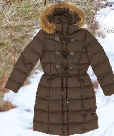
Marlenn 16699 Kč -> 8050 Kč