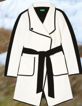
Benetton 3849 Kč

vlevo: Marlenn Twin-Set kožich 8999 Kč -> 5399 Kč, kratasy 5699 Kč -> 3419 Kč, boty John Garfield 949 Kč vpravo: Marlenn kabát 15399 Kč -> 9239 Kč, Elte šaty Rinascimento 7099 Kč -> 4259 Kč, boty John Garfield 949 Kč -> 759 Kč