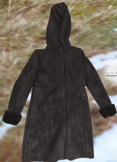
Elte 10799 Kč -> 6479 Kč