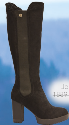
John Garfield 4889 Kč -> 1500 Kč